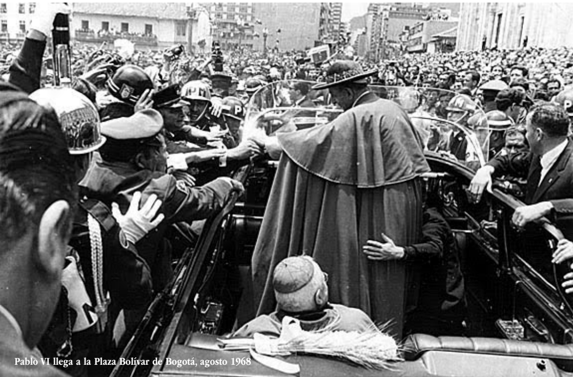
Pablo VI llega a la Plaza Bolívar de Bogotá, agosto 1968