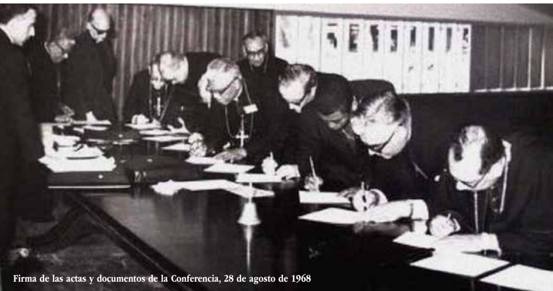
Firma de las actas y documentos de la Conferencia, 28 de agosto de 1968

La Iglesia en la actual transformación de América Latina a la Luz del Concilio